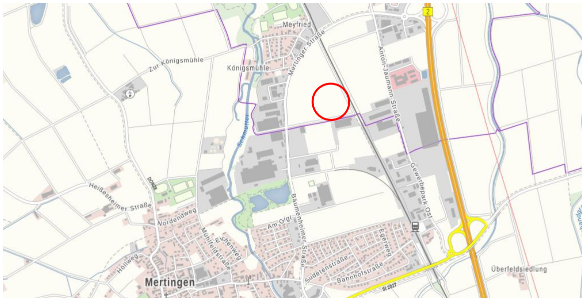
Abb. 1: Lage im Raum, ohne Maßstab

Das Planungsgebiet liegt an der Gemeindegrenze von Asbach-Bäumenheim zu Mertingen auf landwirtschaftlicher Nutzfläche. Unmittelbar südlich angrenzend liegt eine Betriebshalle und das Betriebsgelände der Firma Zott. Östlich grenzt die Bahnlinie mit einer Teilstrecke zwischen Donauwörth und Augsburg an das Planungsgebiet.