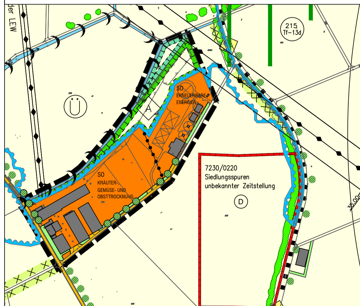
A2 AUSSCHNITT AUS DEM GEÄNDERTEN FLÄCHENNUTZUNGSPLAN